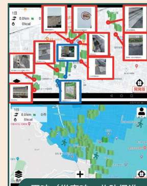
平時／災害時の共助促進のための地域資源／リスク情報共有アプリ