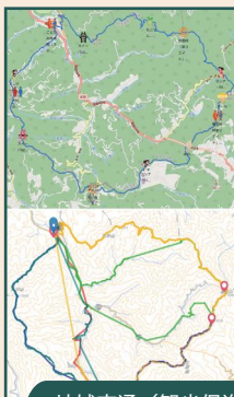
地域交通／観光促進のための公共交通／人流可視化アプリ